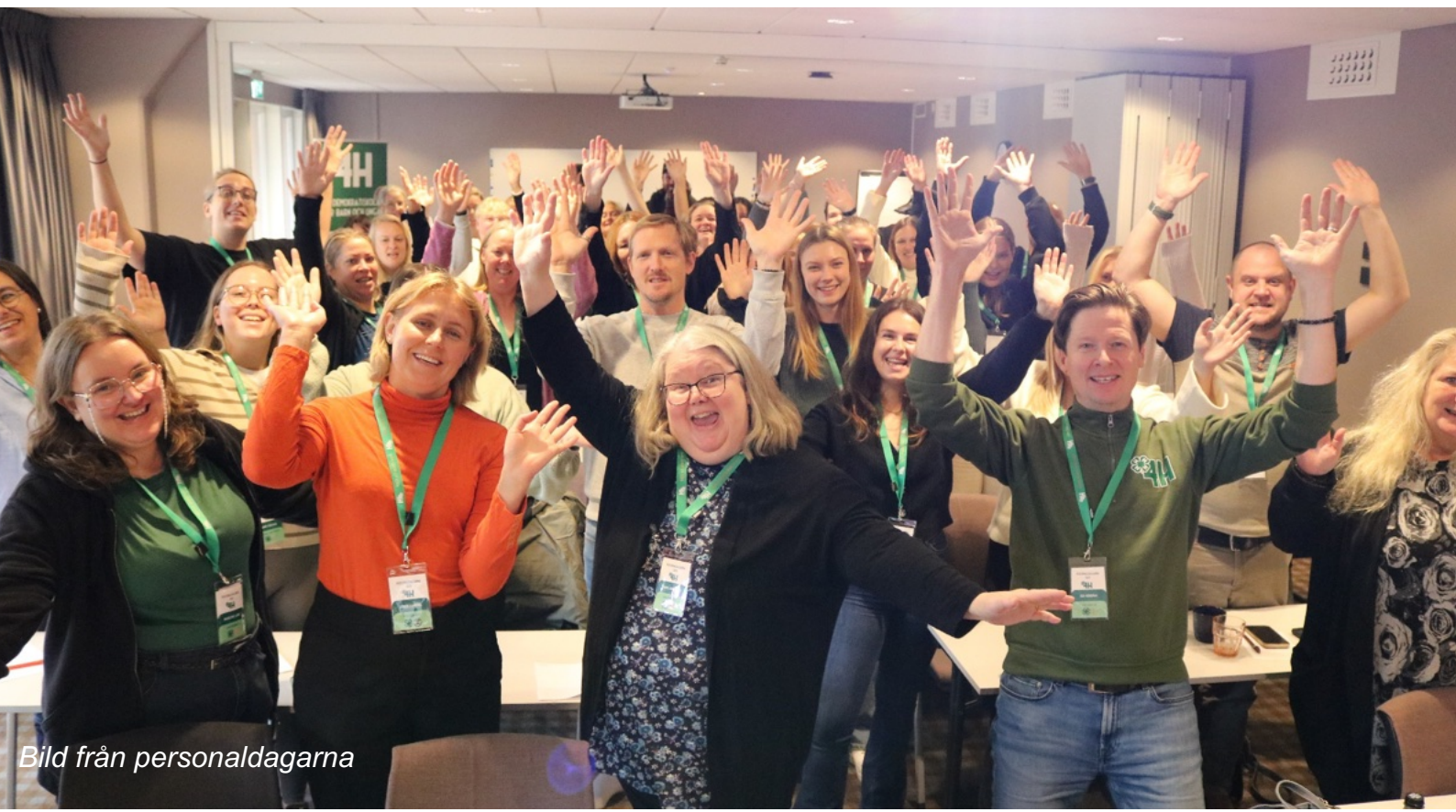
Bild från personaldagarna

Funktionerna är fördelade mellan olika orter: löneservice hanteras i Uppsala, vaktmästeri, och administration utgår främst från Katrineholm, ekonomi sköts från både Katrineholm och Halmstad medan verksamhetsutveckling, projektledning, kommunikation och ytterligare administrativa funktioner är placerade i Stockholm.