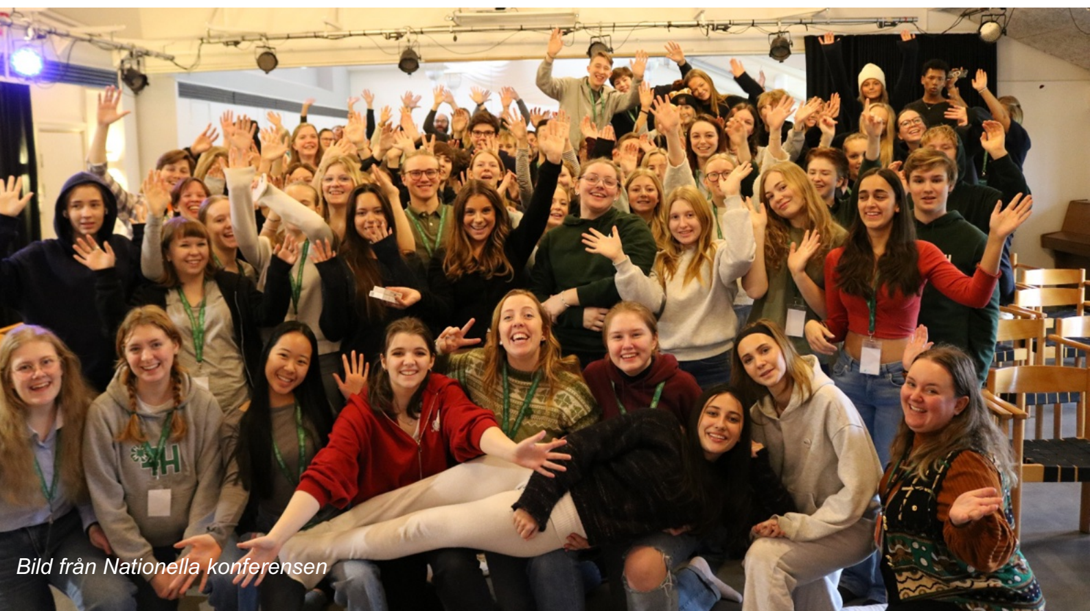
Bild från Nationella konferensen

Arbetet bidrar till att göra 4H mer tillgängligt och stärker möjligheten för fler barn och unga att delta, samtidigt som det stödjer långsiktig medlemsutveckling.