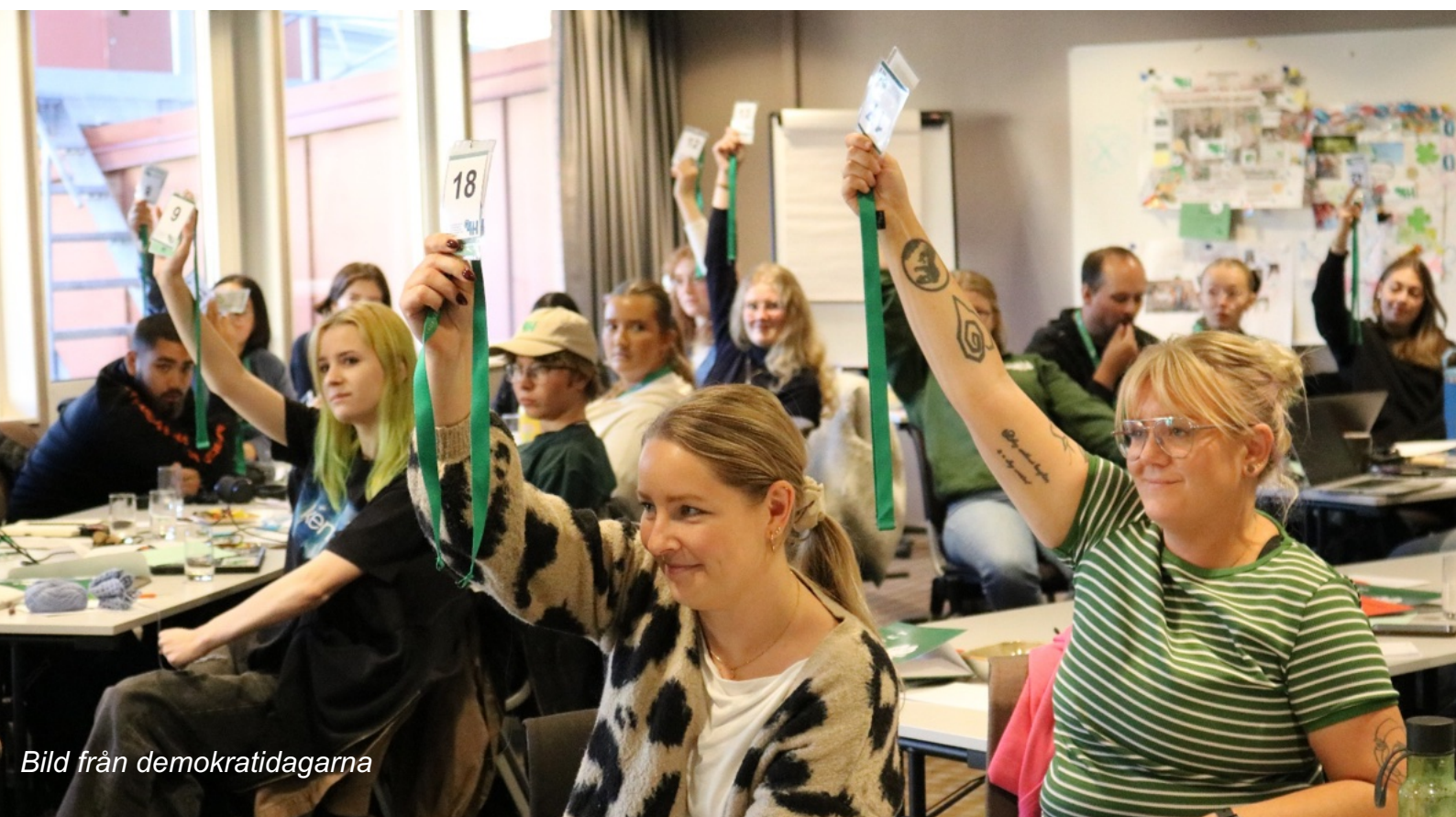
Bild från demokratidagarna

De förväntade effekterna är redan synliga i form av ökad dialog om hållbarhet i alla delar av 4H, där fokus har flyttats från abstrakta styrdokument till vardagsnära, begripligt och görbart hållbarhetsarbete. På sikt innebär detta att hållbarhet fortsätter vara en självklar del av 4H:s verksamhet och att medlemmar, ideella och personal förstår vad det betyder i praktiken och agerar utifrån det. Projektet stärker därför organisationens förmåga att leva som man lär, att med huvud, hjärta, hand och hälsa bidra till ett hållbart samhälle.